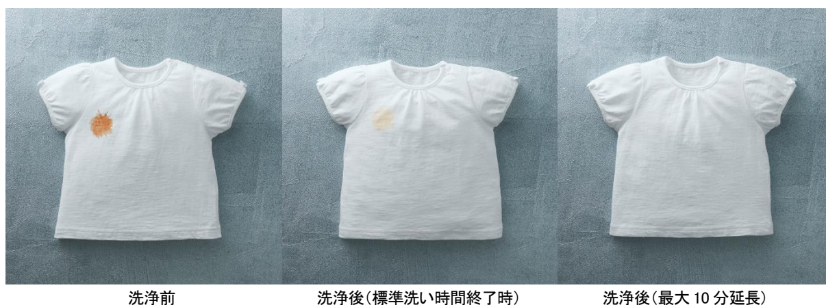
[図 6 AI お洗濯の効果 (*)9 ]