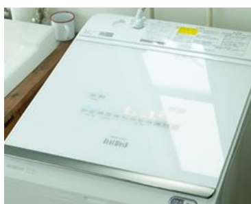
【図 8 ガラスタッチ式操作パネル】