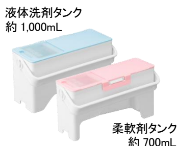
【図 2 液体洗剤タンク・柔軟剤タンク】