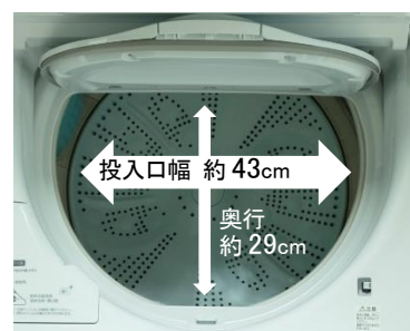
【図 9 広びろ投入口】