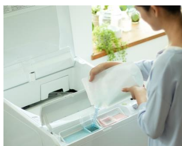
【図 7 液体洗剤・柔軟剤自動投入】

さらに、衣類温度約 65℃で乾燥し、やさしく仕上げる「低温乾燥」コースを新たに 12kg タイプにも採用したことに加え、洗い方や時間を自動で判断し細かな設定もお任せの「AI お洗濯」 (*11) 、ボタンが見やすく押しやすい「ガラスタッチ式操作パネル」(図 8)、洗濯物が出し入れしやすい「広びろ投入口」(図 9)など好評な機能を継続して搭載し、使い勝手にも配慮しています。