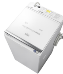
ホワイト(W) タテ型洗濯乾燥機 BW-DX120E