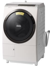
ロゼシャンパン(N) ドラム式洗濯乾燥機 BD-SX110E

「液体洗剤・柔軟剤自動投入」機能や「AI お洗濯」に加えて、スマートフォン連携機能を新たに搭載 ドラム式洗濯乾燥機「ヒートリサイクル 風アイロン ビッグドラム」、 タテ型洗濯乾燥機「ビートウォッシュ」を発売