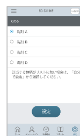
【図 3 液体洗剤・柔軟剤銘柄設定 (アプリ)】

(*)1 液体洗剤は 810mL 以下、柔軟剤は 540mL 以下の詰め替え用タイプが一度に補充できます。